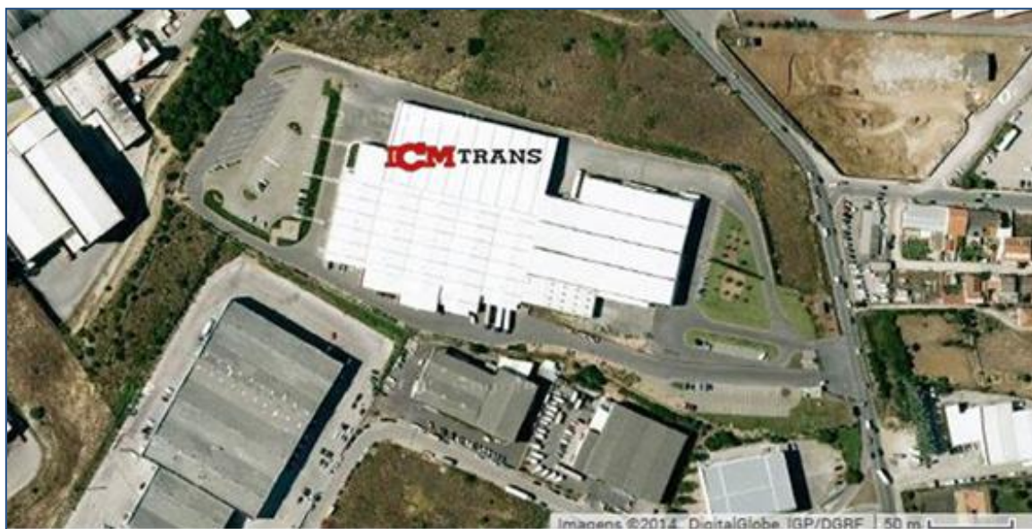
Figura 2 - Área geográfica do cenário

d. A ocorrência teve origem na deflagração de um incêndio na zona de armazenagem de produtos biocidas, que se generalizou à totalidade dos produtos contíguos. O calor produzido no incêndio, além de provocar a dilatação dos recipientes aerossóis e conseqüente rebentamento, ocasionou a libertação de gases tóxicos para a atmosfera. A equipa de intervenção interna procedeu de acordo com os procedimentos constantes no PEI, mas não conseguiu controlar o incêndio. Com a chegada dos meios de intervenção externos iniciaram-se as operações de combate pelas equipas de socorro que passaram a comandar toda a intervenção.